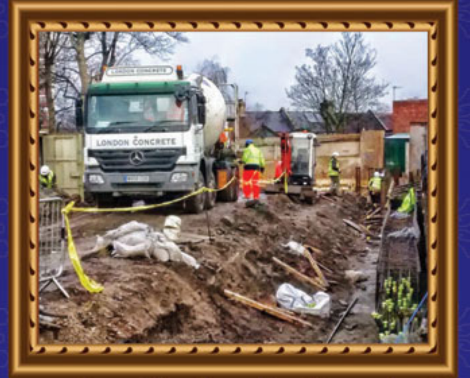
નૂતન મંદિરનું પૂરજોશમાં ચાલતું બાંધકામ - વુલ્વીચ યુ.કે.