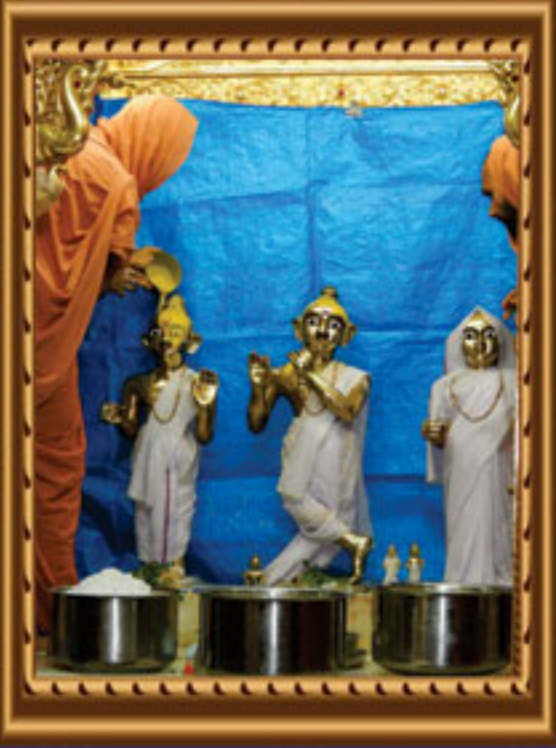
શ્રી વૃન્દાવનવિહારી હરિકૃષ્ણમહારાજનો ૧૫૫ મો વાર્ષિક પાટોત્સવ - માંડવી