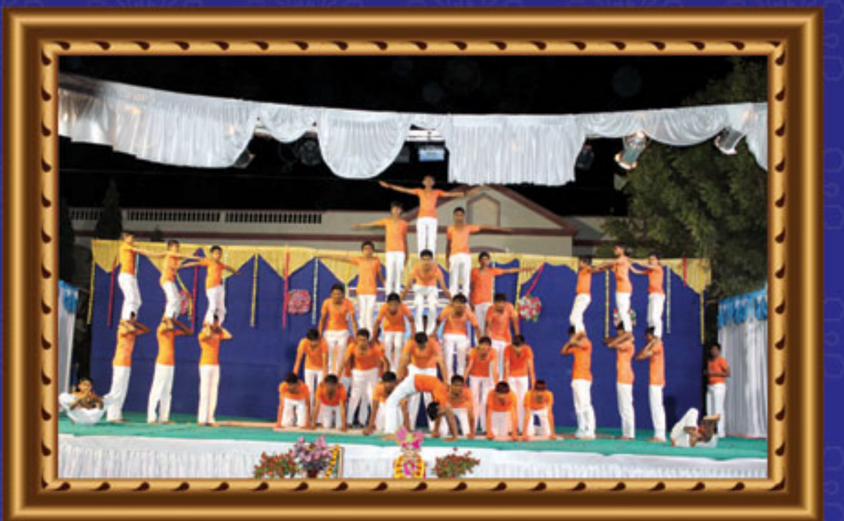
શ્રી સ્વામિનારાયણ ગુરુકુલ, ગાંધીધામમાં શાકોત્સવ તથા વાર્ષિકોત્સવ