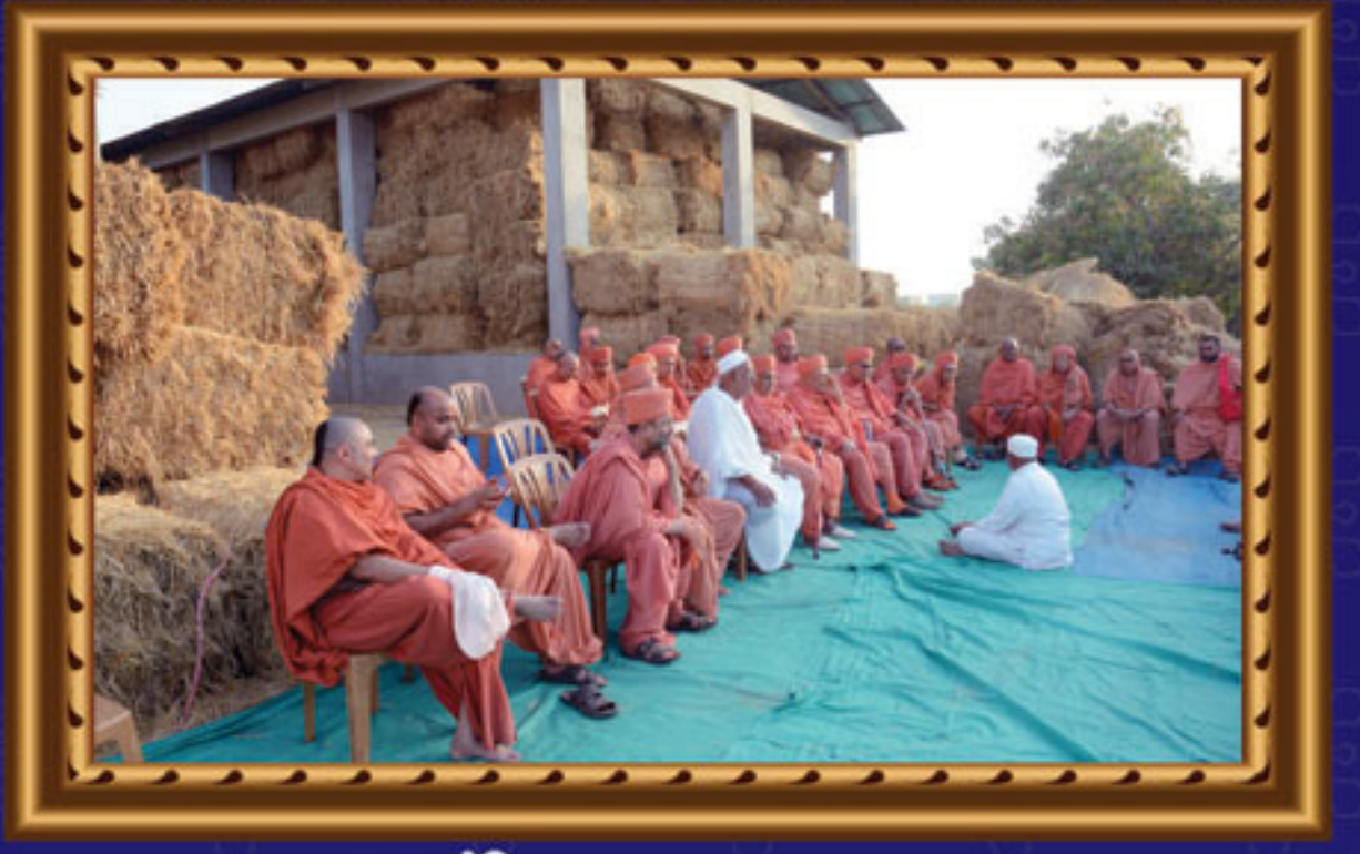
ભુજ મંદિર દ્વારા દુષ્કાળ રાહત નિમિત્તે ગાયો માટે ઘાસ ચારાનો સંગ્રહ