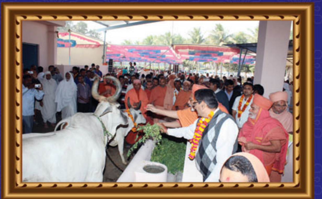
શ્રી ઘનશ્યામ ગૌશાળાનું ઉદ્ઘાટન - અંજાર