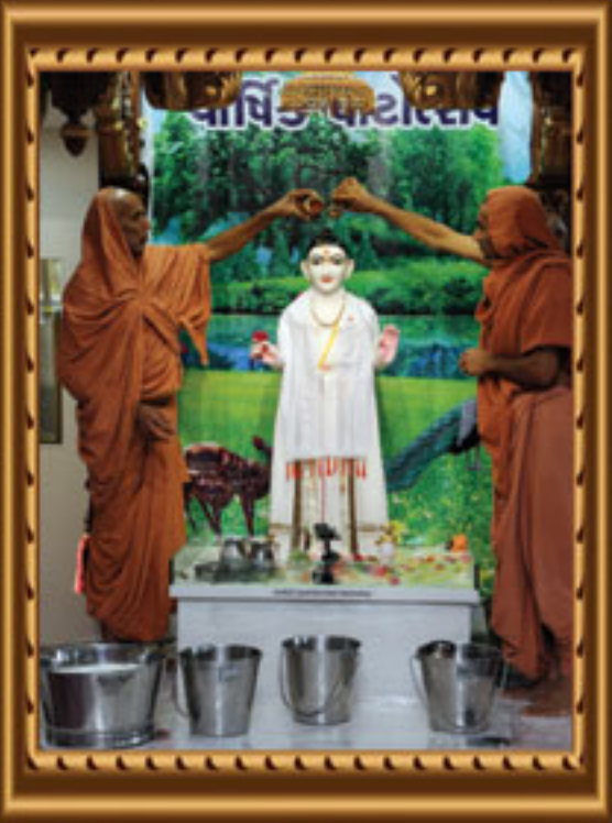
મંદિરના વાર્ષિક પાટોત્સવ નિમિત્તે અભિષેક, અન્નકૂટ દર્શન તથા ઘજારોહણ - પર્થ ઓસ્ટ્રેલિયા