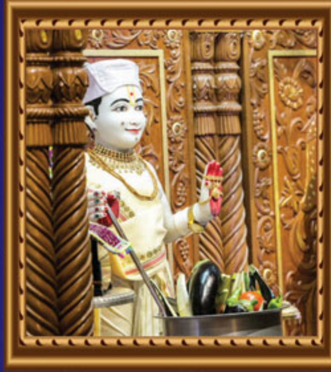
શ્રી સ્વામિનારાયણ મંદિરમાં શાકોત્સવ - સ્ટેનમોર યુ.કે.