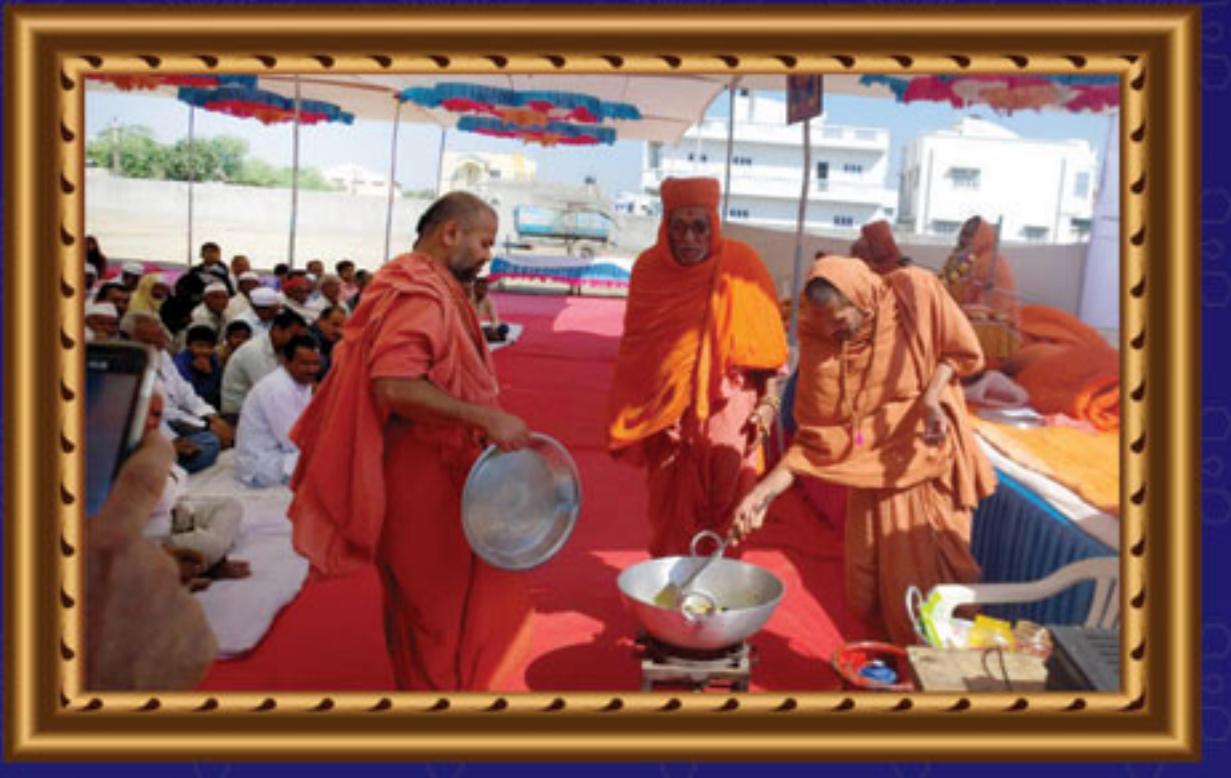
શ્રી સ્વામિનારાયણ મંદિરમાં શાકોત્સવ - મુન્દ્રા