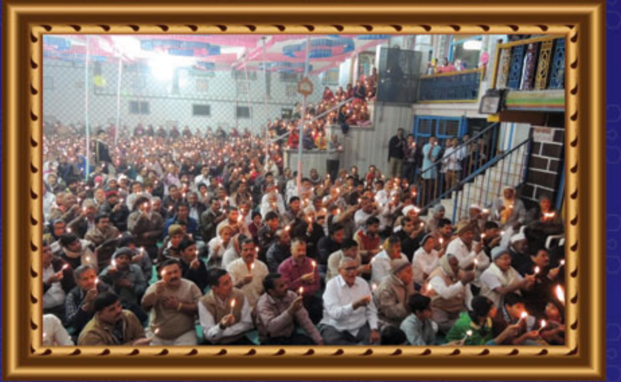
મંદિરમાં શિક્ષાપત્રીનું પૂજન તથા મહાઆરતીનો લાભ લેતો ભક્ત સમુદાય - અંજાર