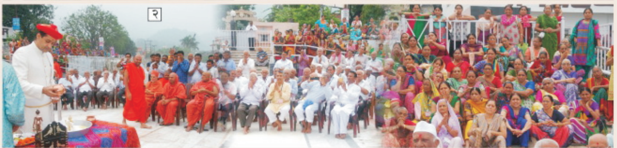
( १ ) पवित्र श्रावण मास में नारायणघाट मंदिर में प्रसादी के शिवलिंग का पूजन करते हुए प.पू. बड़े महाराजश्री । ( २ ) श्री स्वामिनारायण मंदिर नारायणपुरा द्वारा आयोजित ऋषिकेश में गंगा के किनारे गंगाजल से ठाकुरजी का अभिषेक करते हुए प.पू. आचार्य महाराजश्री तथा श्रीमद् सत्संगिजीवन पारायण का पान करते हुए संत-हरिभक्त ।