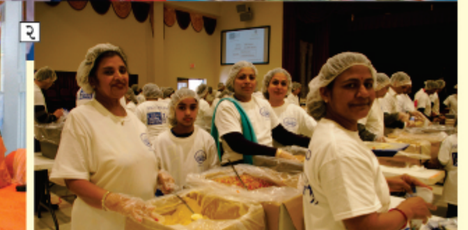
१.टिपोटर गामे शाकोत्सव करता प.पू. ध. धु. आचार्य महाराजश्री तथा आचार्य महाराजश्रीनी आरती उतारता यजमान परिवार २.शिकागो मंदिरमां सभामां आशीर्वाद आपता प.पू. आचार्य महाराजश्री तथा शिकागोमां आवेल कुदरती छोनारत समये मंदिर द्वारा डूड पेकेट बनावता छरिभक्तो .